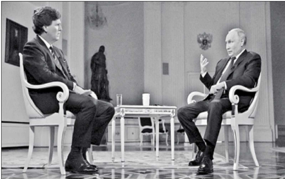
▲ El presidente ruso, Vladimir Putin (derecha), y Tucker Carlson, en el Kremlin.

PL_c0Ld7psDsw?view_as=subscriber • https://vm.tiktok.com/ZM8KnkKQn/ • https://twitter.com/AlfredoJalife • Instagram: https://instagram.com/alfredojalifer?utm_source=qr (@alfredojalifer)