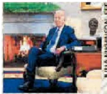
Joe Biden, presidente estadounidense.

La Corte de Apelaciones de Estados Unidos para el Circuito del Distrito de Columbia señaló que la afirmación de que Trump es inmune a la responsabilidad penal por las acciones que tomó mientras estaba en la Casa Blanca, "no está respaldada por precedentes, historia o el texto y la estructura de la Constitución". ●