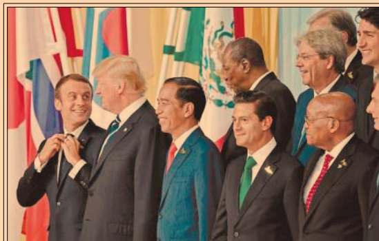
G20 atenderá sobreproducción de acero, combatirá el proteccionismo e impulsará sistema fiscal justo. Trump y Putin acercan posiciones. P4-6 Y 51

Actuaría que encabezó embargo desvirtúa los hechos de un allanamiento en el acta que presentó al juez. P41