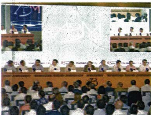
Convención anual de la convención anual de la Asociación de Bancos de México (ABM).