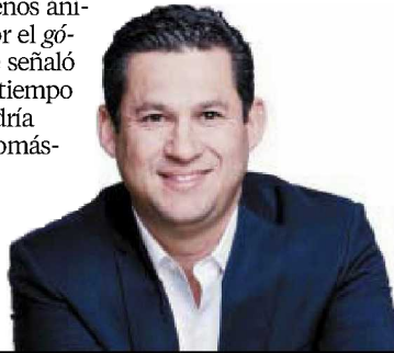
Diego Sinhué Rodríguez