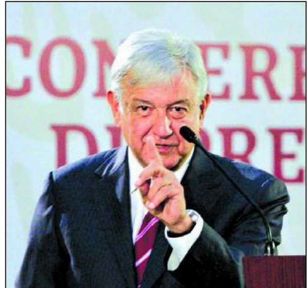
Andrés Manuel López Obrador.