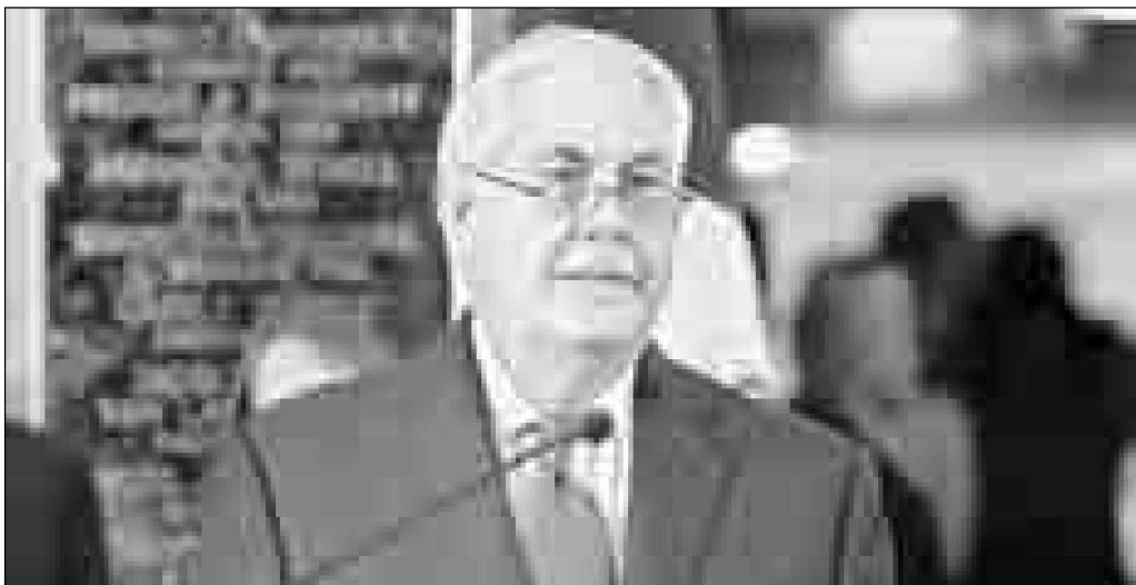
El ex secretario de Estado de Estados Unidos, Rex Tillerson, terminó enemistado con el presidente Donald Trump. En la foto se despide de su personal en Washington, DC.