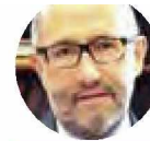
José Ramón Cossío

Nos hacen ver que para definir al nuevo ministro de la Corte, que relevará a José Ramón Cossío, los senadores de Morena deben cabildear con la oposición, pues necesitan al menos 85 votos, y ese partido con sus aliados suman sólo 70. Y con eso de que están peleados con PRI, PAN y MC, por el tema de los salarios, se prevé una negociación difícil.