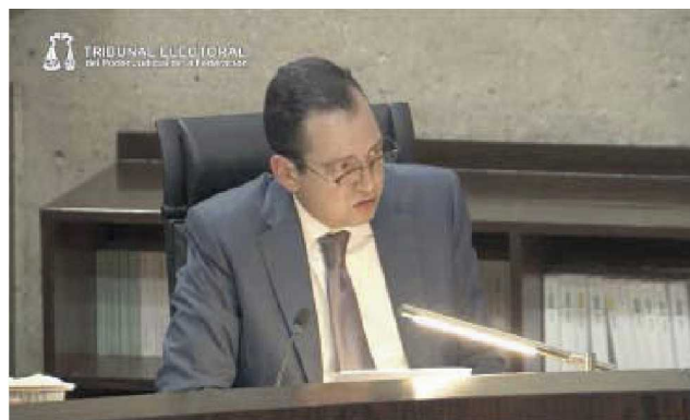
TOMADA DE VIDEO