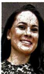
Alejandra del Moral

:::: Nos platican que ya está claro la forma en la que los partidos políticos irán a las urnas en la elección extraordinaria del municipio de Nextlalpan que se llevará a cabo el 14 de noviembre. El PRI, cuya dirigente es Alejandra del Moral , amarró al PRD y PAN para ir en alianza, lo cual quedó registrado en el Instituto Electoral del Estado de México (IEEM), mientras que Morena irá solo al igual que PVEM, Partido del Trabajo, Movimiento Ciudadano. Nos comentan que las campañas iniciarán el próximo 27 de octubre, por lo que desde hoy empieza la cuenta regresiva, ahora, por elegir a los candidatos que volverán a las calles a pedir el voto, pero, sobre todo, a conciliar y evitar la violencia que fue la que provocó la anulación de la elección del pasado 6 de junio.