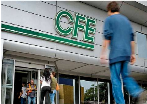
La Comisión Federal de Electricidad, empresa paraestatal.