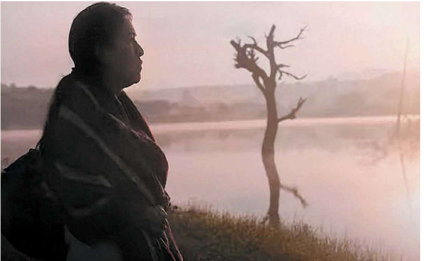
La cinta dirigida por Fernanda Valadez relata la historia de Magdalena, una mujer que busca a su hijo desaparecido. CLAUDIA BECERRIL