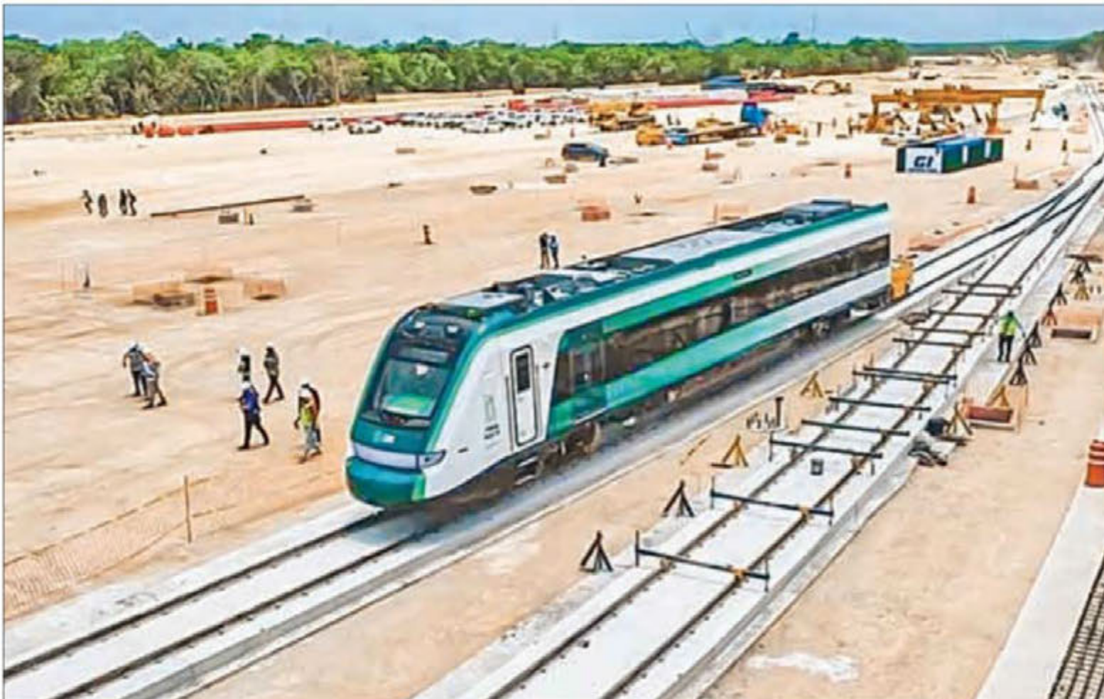
▲ El presidente Andrés Manuel López Obrador presenció ayer el arribo del furgón procedente de Ciudad Sahagún, Hidalgo, en cuyo traslado participaron 80 personas, quienes recorrieron mil 943 kilómetros en 24 horas. Vigilaron el trayecto elementos de la Guardia

Nacional y el Ejército, así como personal de Fonatur. Hoy llegan otros tres vagones para armar el primer convoy y empezar las pruebas dinámicas, a fin de tenerlo listo para su inauguración en diciembre.