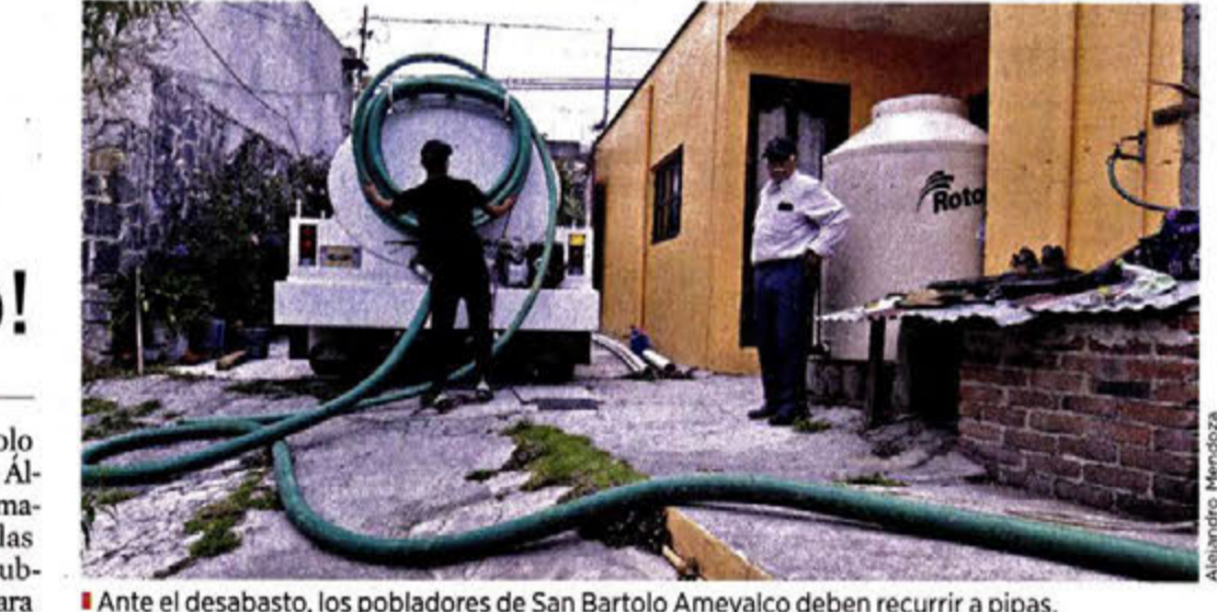
Ante el desabasto, los pobladores de San Bartolo Ameyalco deben recurrir a pipas.

IVÁN SOSA El pueblo de San Bartolo Ameyalco, en la Alcaldía Álvaro Obregón, tiene un manantial. Sin embargo, las aguas que brotan del subsuelo son insuficientes para los 35 mil habitantes, quienes padecen escasez. Después de 9 años resurgió el conflicto en colonias establecidas en las laderas de las montañas por la falta de agua. Hoy se realizará una consulta comunitaria sobre la realización de obras por parte del Sistema de Aguas de la Ciudad de México (Sacmex), que permitirían mejorar el abasto entre los pobladores. Regenerado por las lluvias precipitadas sobre el bosque del Desierto de los Leones, colindante con San Bar-