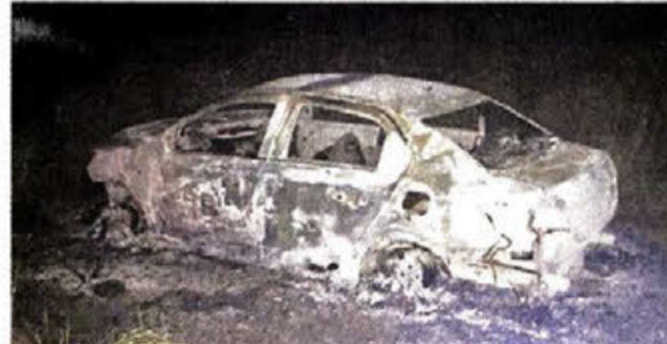
El automóvil en el que viajaba el mando policiaco de Villaldama, NL, apareció incendiado y con dos cuerpos.