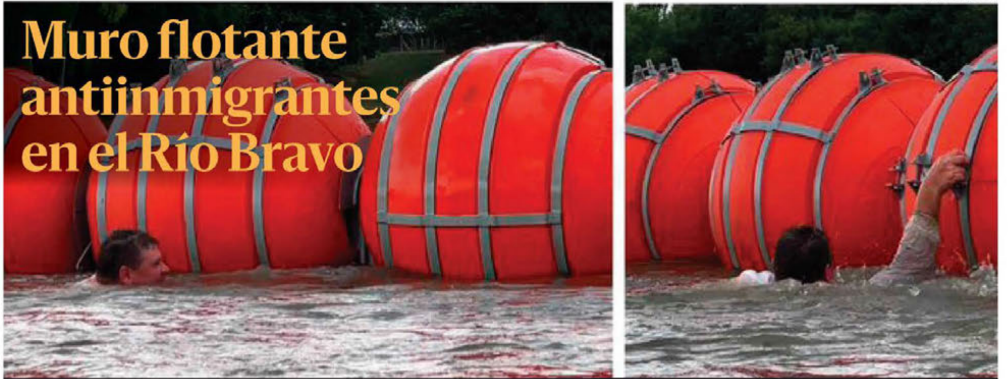
Cuatro camiones cargados con gigantescas boyas aguardan en la frontera entre Eagle Pass y Piedras Negras, Coahuila, para ser colocadas en el Río Bravo por personal de seguridad texanas, como medida para contener el cruce de indocumentados. En la foto, personal del gobierno de Texas, en una prueba piloto. PAG 5