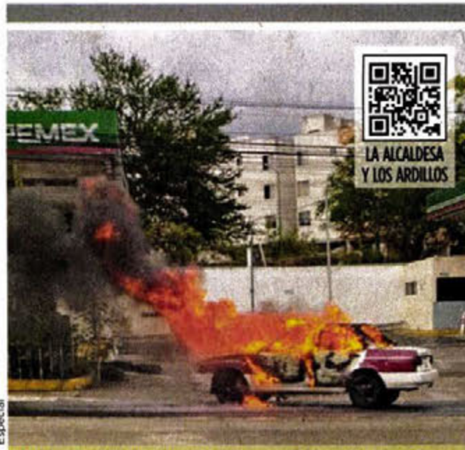
Varios vehículos de transporte público y sus conductores fueron atacados ayer en la capital de Guerrero.