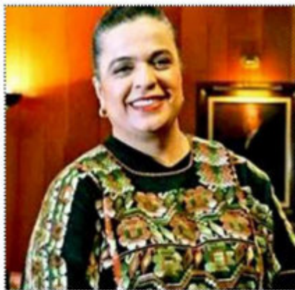
La política no es un vodevil: Beatriz Paredes Rangel