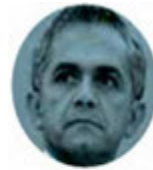
MIGUEL ÁNGEL MANCERA

› Gran expectativa ha generado la presentación del proyecto de seguridad de Marcelo Ebrard . Este lunes, la corcholata morenista dará detalles sobre su "Plan Ángel", con el que ofrece "el México más seguro de la historia". Nos dicen que en Morena están muy interesados en conocerlo, pues esperan que no contradiga el actual modelo de abrazos no balazos.