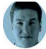
SAMUEL SE BURLA DEL PRIAN

› Bien arropada estuvo Delfina Gómez en la ceremonia de recepción de su constancia de mayoría, que la acredita como gobernadora electa del Estado de México. En la sala de sesiones del IEEM, la maestra estuvo acompañada de sus operadores de campaña Horacio Duarte e Higinio Martínez , el representante de Morena ante el Instituto. Francisco Vázquez , además de diputados locales y alcaldes, quienes convirtieron el acto en una fiesta.