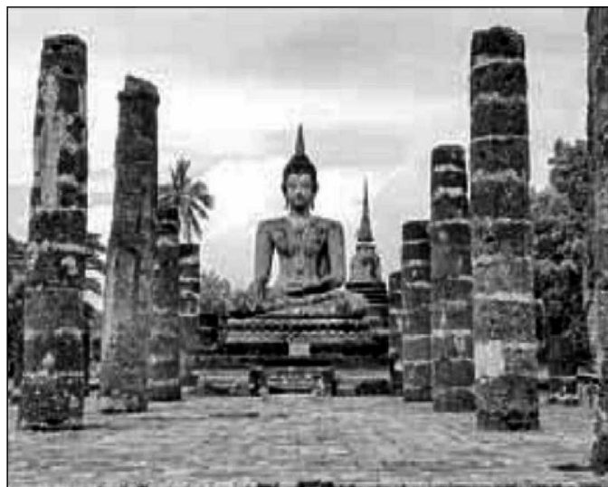
▲ Una monumental figura de Buda tallada en piedra en las ruinas del parque histórico de Sukhothai en Tailandia.

LA VEGETACIÓN ES exuberante, numerosos estanques embellecidos con lirios blancos y sobre todo la cantidad de estatuas de Buda en las más diversas dimensiones dan una experiencia singular si se toma en cuenta que se considera un lugar sagrado.