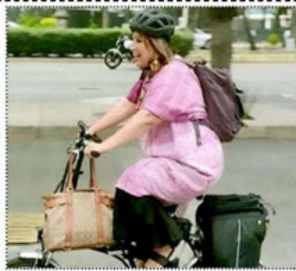
Imparable Xóchitl Gálvez