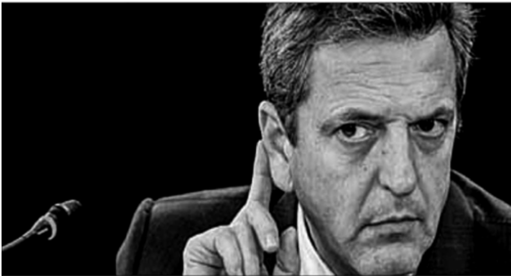
▲ Sergio Massa, ministro de Economía argentino, quien estableció el acuerdo con

http://alfredojalife.com https://www.facebook.com/AlfredoJalife https://vk.com/alfredojalifeoficial https://t.me/AJalife https://www.youtube.com/channel/UC1fxjOThZDPL_c0Ld7psDsw?view_as=subscriber https://vm.tiktok.com/ZM8KnkKQn/ https://twitter.com/AlfredoJalife