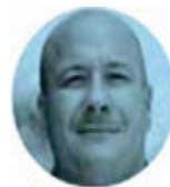
Y EL PRIAN COQUETEJA CON ALFARO

› Se sumó el gobernador de Nuevo León, Samuel García , a las críticas contra el Frente Amplio por México. En un acto público en General Terán, el mandatario se burló de las peticiones para que MC se adhiera al bloque opositor y refirió que mientras los emecistas tienen 80% de aprobación, el PRI y el PAN están "en el suelo".