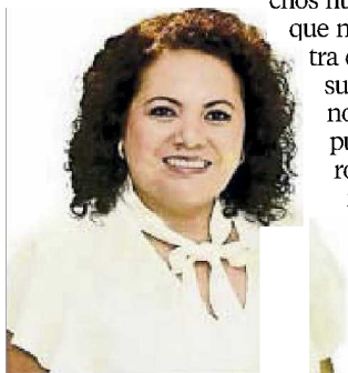
Aurelia Leal López

Y también en este contexto, nos cuentan que la alcaldesa de Guasave, Sinaloa, Aurelia Leal López (Morena), pasó un 8 de marzo entre escándalos, luego de que dos empleadas denunciaron haber sido víctimas de acoso sexual por parte de su jefe, el director de Prevención Social. Aunque doña Aurelia es conocida por su larga lucha en el tema de la equidad de género y los derechos humanos, nos dicen, llamó la atención que no tomara una actitud lapidaria contra el funcionario, como solía hacerlo en sus años de activismo. Está por verse, nos indican, qué pasará en el camino, pues ambas denunciantes ya aseguraron que llevarán el asunto hasta sus máximas consecuencias.