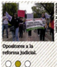
Opositores a la reforma judicial.