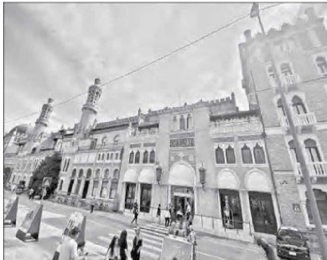
▲ La fachada del emblemático hotel, donde las personalidades de la Mostra se alojan, llega a costar cientos de dólares por noche.