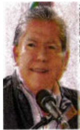
David Monreal Ávila

:::: El que anda "con el Jesús en la boca" en Zacatecas, nos platican, es el gobernador David Monreal Ávila (Morena) por el temor de que alguna manifestación opaque este domingo su mensaje