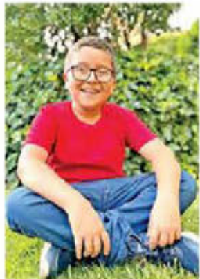
Para Francisco, ser niño es ser libre de hacer lo que se ama.

"La gente piensa que no somos ciudadanos, pero ser ciudadano no sólo es ejercer el derecho al voto, también