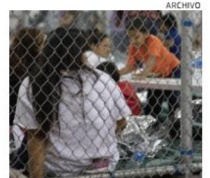
Presentarán informe a Joe Biden.

Informe. Más del 18% de los inmigrantes que cruzaron la frontera sur de Estados Unidos y estuvieron bajo la custodia de la Patrulla Fronteriza en las últimas dos o tres semanas dieron positivo a COVID, reveló un documento de las autoridades federales. Agrega que también el 20% de menores que llegaron solos a la frontera sur de EU dieron positivo a coronavirus. PAG 16