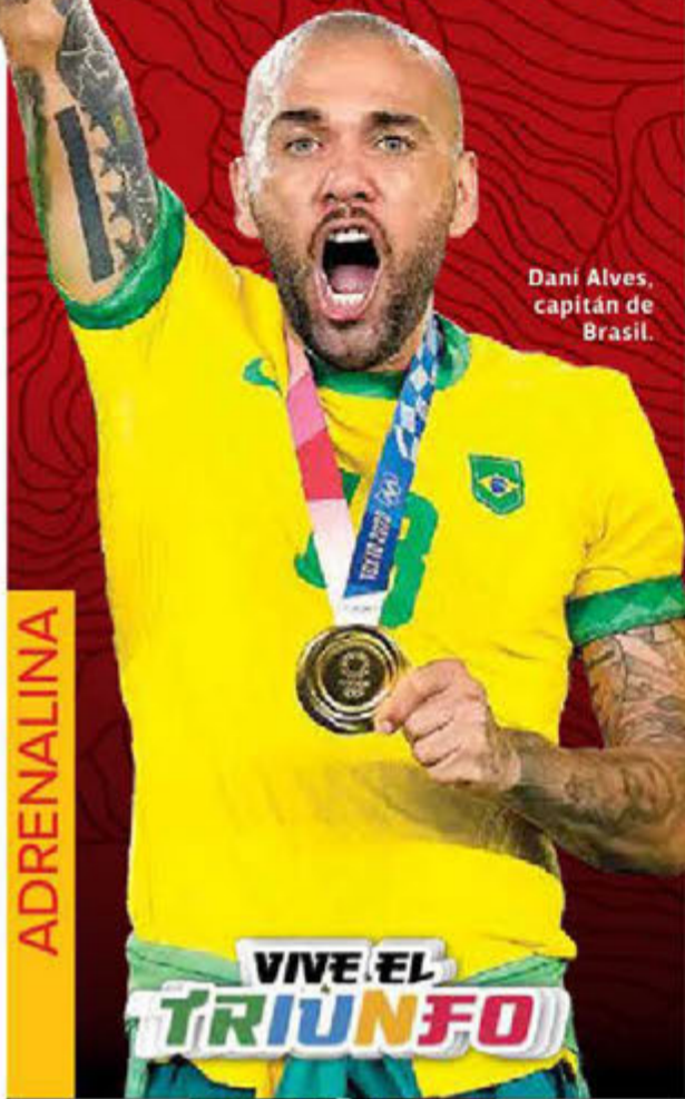
Dani Alves, capitán de Brasil.

La verdeamarela derrotó a España en tiempos extra y repitió en Tokio la medalla de oro lograda en Río 2016.