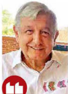
Ni las potencias, que sus políticos hablan día y noche del cambio climático, llevan a cabo una acción así."

Por su inversión y alcance, es el mayor programa de reforestación en todo el mundo, dijo el presidente López Obrador. / 17