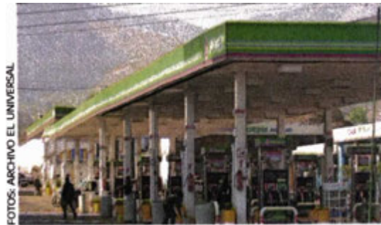
México, con la cuarta gasolina más cara de AL.