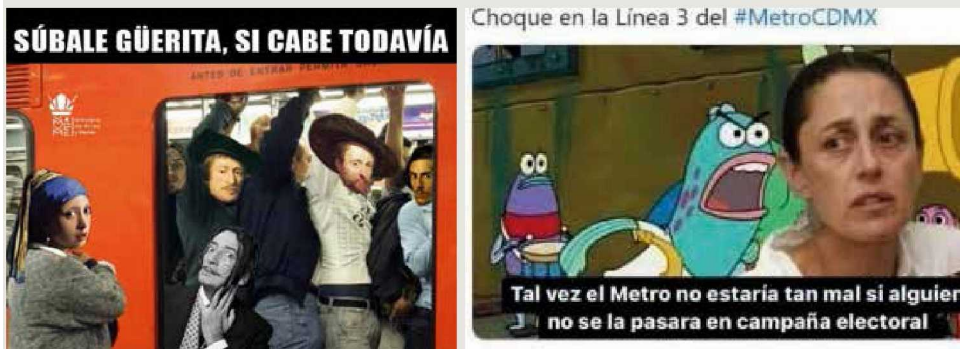
Memes en redes