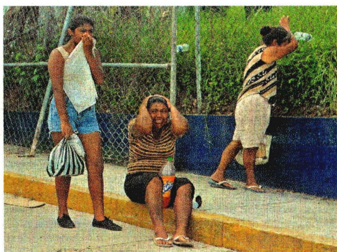
Familiares de los presos se manifestaron afuera del penal.

sarrolló en la zona denominada de "máxima seguridad", donde se encuentran los presos de alta peligrosidad.