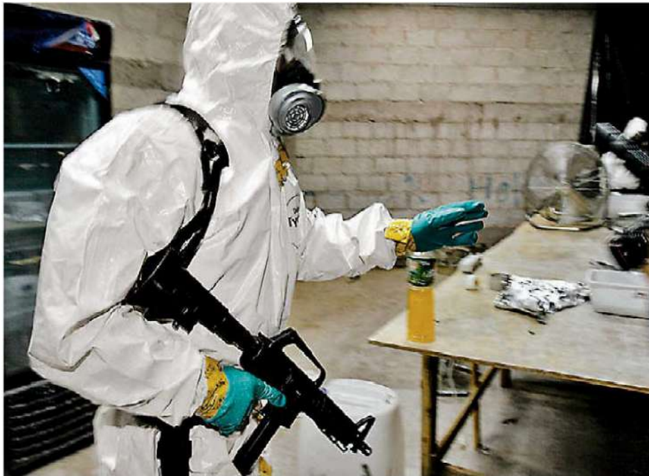
Elementos de la AFI aseguran laboratorio de drogas en Hidalgo. OMARMENESES