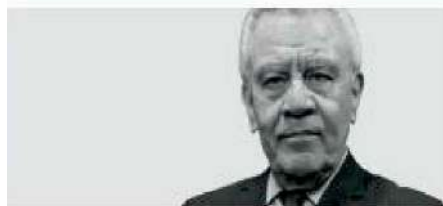
Lic. Rocío Nahle, Secretaría de Energía:

C IUDAD DE MÉXICO.- Contrario a la costumbre de la Cuarta Transformación de prolongar los conflictos en un tour de force con los adversarios, así como con dimes y dires en las mañaneras, la huelga del gremio gasero nacional de los distribuidores de gas LP, se resolvió en un santiamén. Qué bueno que así fue, porque extenderlo hubiera sido un desastre económico y social.