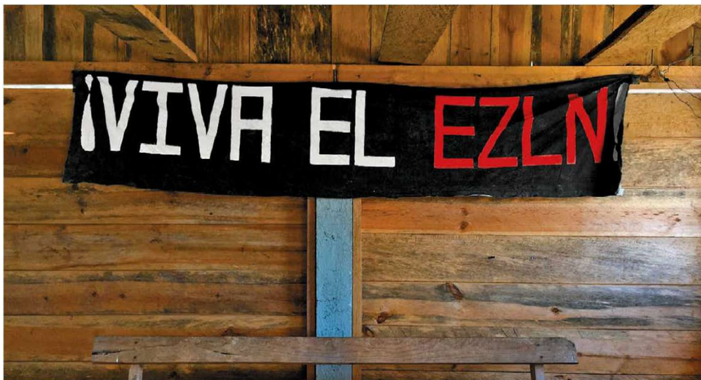
Una manta en uno de los caracoles que forman parte del territorio zapatista en la montaña chiapaneca. AXELPEDRAZA