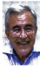
Rubén Rocha Moya

Como en los viejos tiempos en Sinaloa, nos comentan que el gobernador electo Rubén Rocha Moya (Morena) y el mandatario saliente Quirino Ordaz Coppel