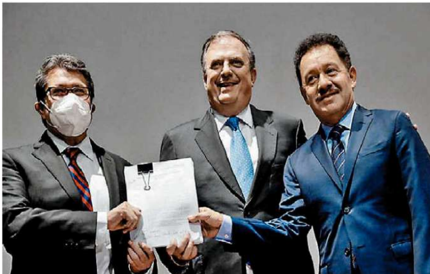
México demandó a fabricantes de armas de EU por negligentes.