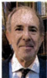
Jaime Serra Puche

..... Nos dicen que el candidato presidencial de Movimiento Ciudadano, Jorge Álvarez Máynez , perdió una buena oportunidad de exponer sus propuestas ante el grupo financiero más grande que opera en México, BBVA. Ayer, al