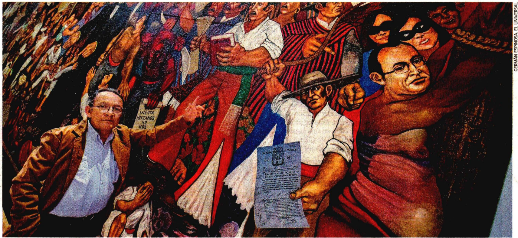
GERMÁN ESPINOSA - EL UNIVERSAL

● Es un preso barato; cuesta 5.20 dólares al día a Guatemala. A14