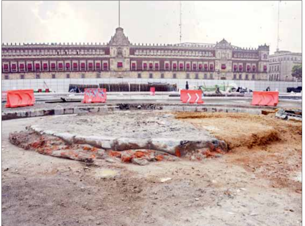
La Secretaría de Obras y Servicios del gobierno capitalino informó que ayer comenzaron los trabajos de cuidado de una plataforma circular ordenada por el entonces presidente Antonio López de Santa Anna para conmemorar la Independencia de México. La estructura fue descubierta el pasado 15 de junio durante los trabajos de rehabilitación de la plancha. De acuerdo con lo solicitado por el Instituto Nacional de Antropología e Historia, la pieza de cantera y piedra se cubrirá con una malla para posteriormente rellenarla de tepetate y darle acabado con concreto