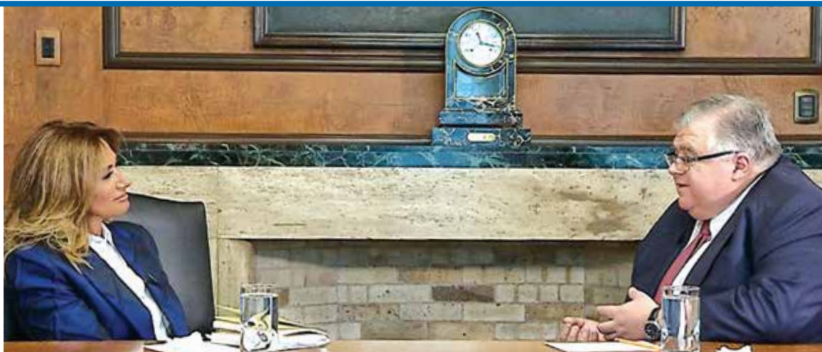
MARCANDO TIEMPOS. A pocos meses de partir, Carstens dice que la economía está fortalecida, pero no libre de tormentas.