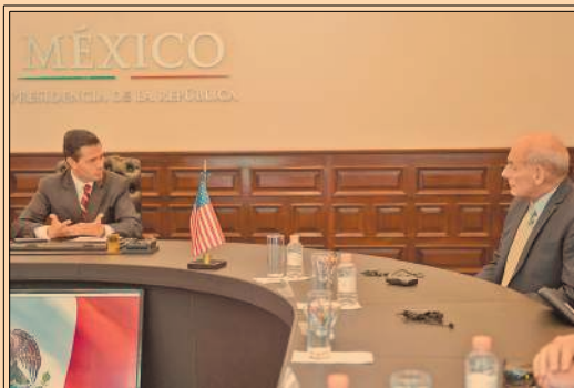
El presidente Enrique Peña Nieto se reunió con el secretario de Seguridad Interior de Estados Unidos, John F. Kelly.

La constructora brasileña Odebrecht reclama a Pemex $300 millones por un contrato inconcluso. P22