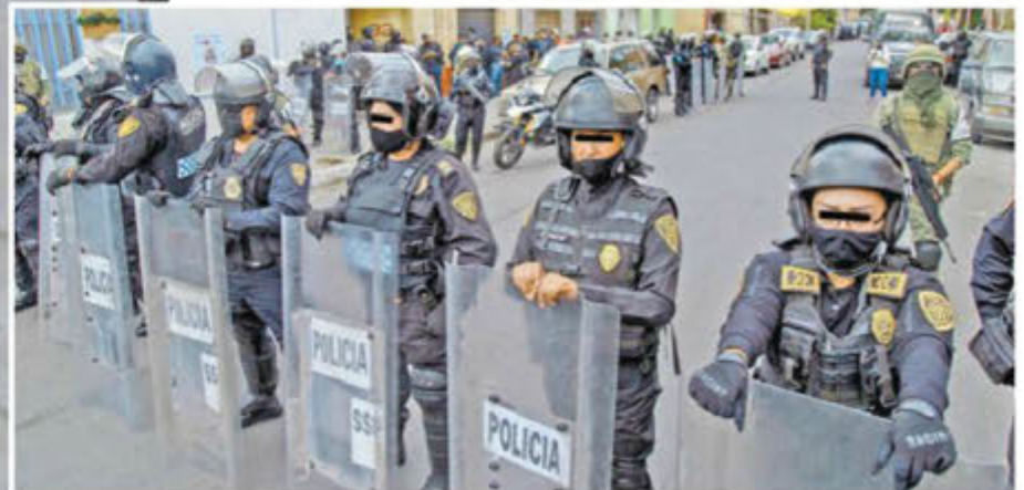
En los operativos participaron la Fiscalía de Justicia, la Secretaría Ciudadana y la Guardia Nacional.