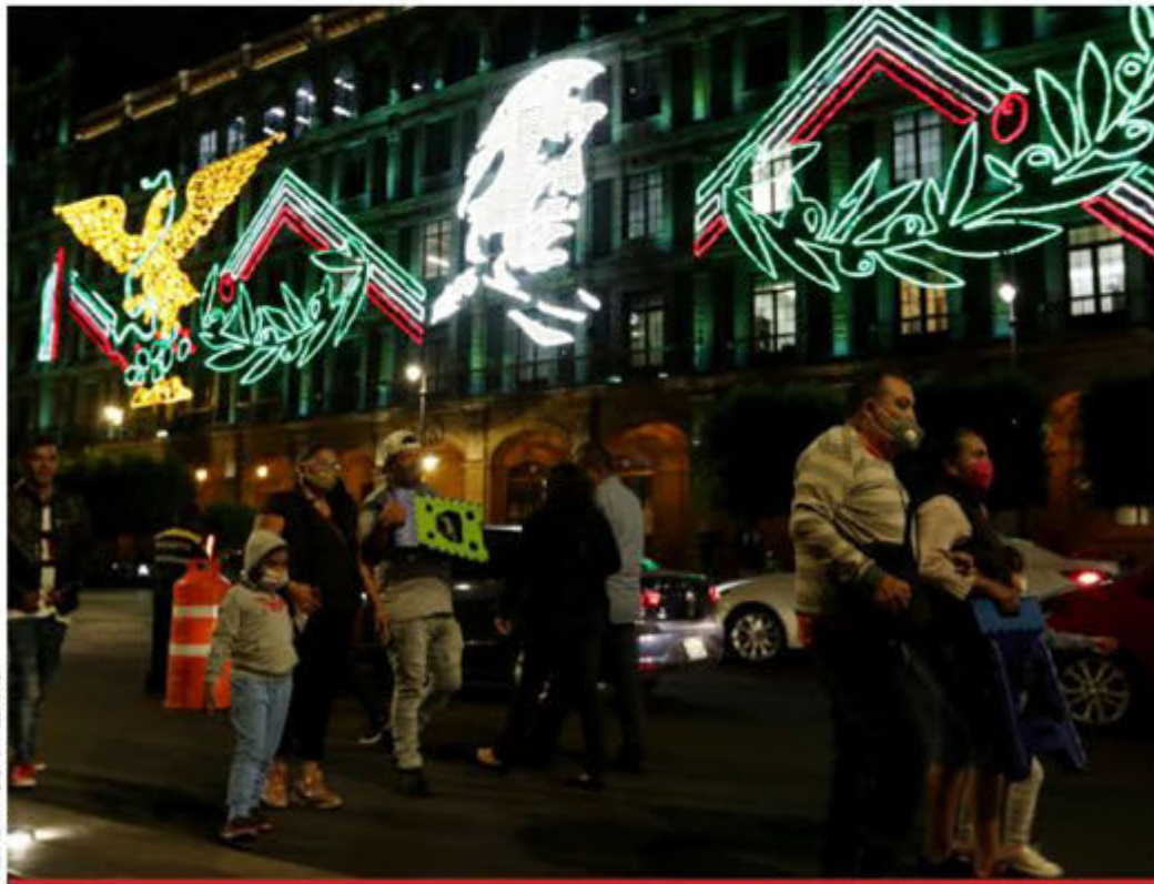
El encendido festivo por el mes patrio atrae a los capitalinos a dar un paseo por el Zócalo.