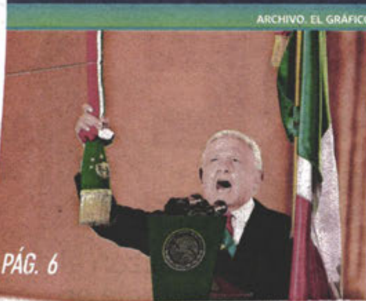
ARCHIVO. EL GRÁFICO

ASESINAN DE UN BALAZO A UN HOMBRE ENCHAMARRADO, EN PARAJE DE NAUCALPAN. PÁGS. 2-3