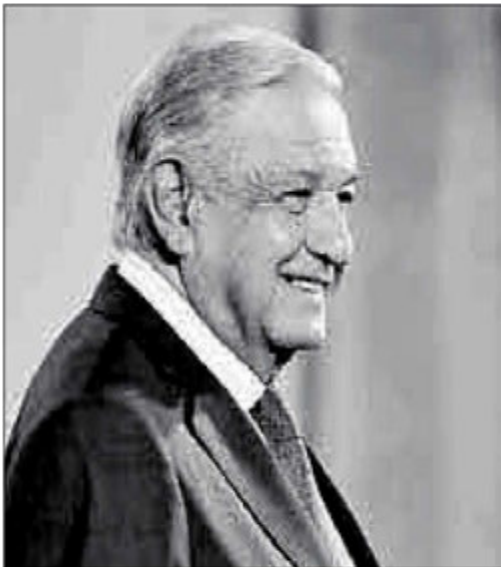
▲ El presidente Andrés Manuel López Obrador y Ricardo Salinas Pliego protagonizan lo que pareciera ser el capítulo final de una larga

Twitter: @cafevega cfmexico_sa@hotmail.com