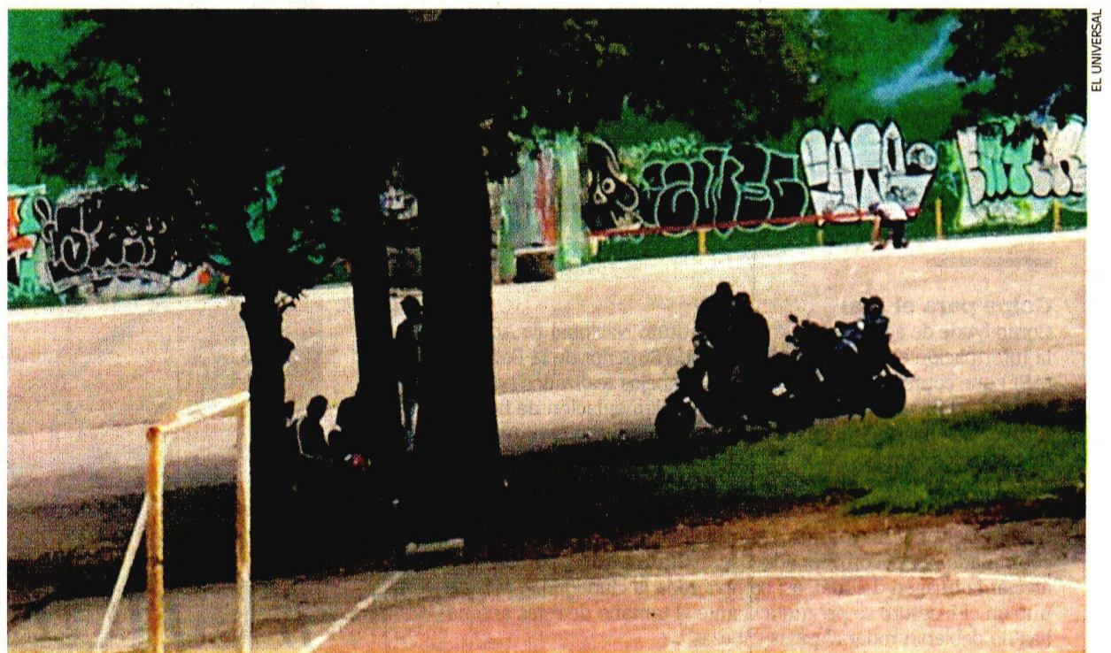
En la zona del frontón se observa a los dealers, a bordo de motocicletas, en espera de compradores.

● Condanan ataque de Trump contra CNN. A22