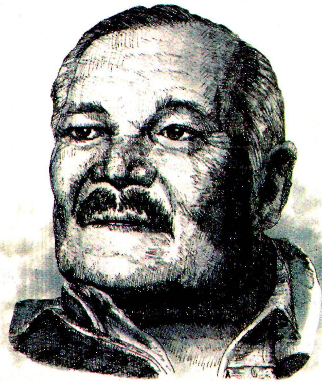
ILUSTRACIÓN ELIJU GALAVIZ

AUTODIDACTA Y estudiante irregular de "La Esmeralda", el pintor, representante de la generación de la Ruptura, falleció a los 83 años; de inmediato las condolencias aparecieron por redes sociales