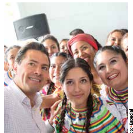
EL MANDATARIO con habitantes de Acapulco, ayer.