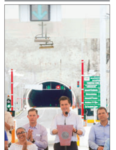
El presidente Peña Nieto, ayer en Acapulco.