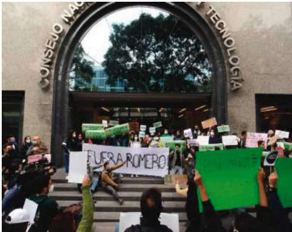
ESTUDIANTES y académicos del CIDE protestan afuera de las oficinas del Conacyt.

Conacyt actúen como entidades gubernamentales