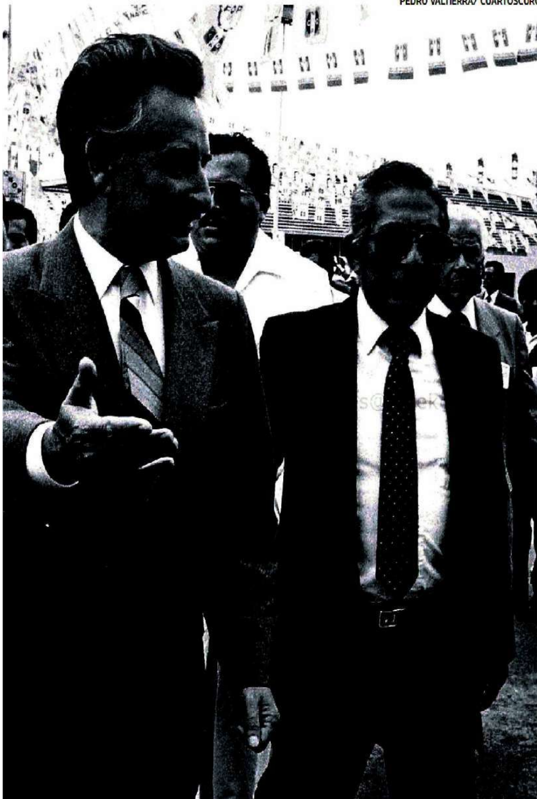
Exgobernador Fernando Gutiérrez y el líder sindical petrolero Joaquín Hernández, alias La Quina