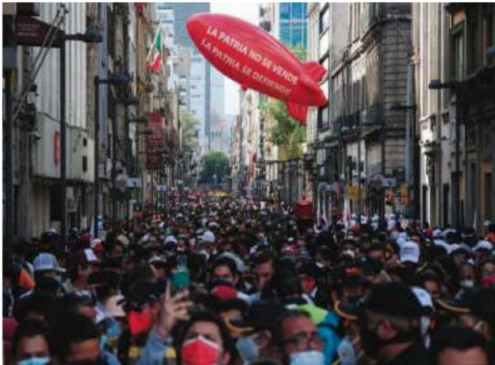
ASISTENTES al AMLOFest, en el Centro Histórico de la CDMX.

pan de que el pueblo sufra las consecuencias de su mala elección, y, además, se sienten decepcionadas, incluso indignadas, de que el pueblo ingrato no haya querido aceptar su recomendación