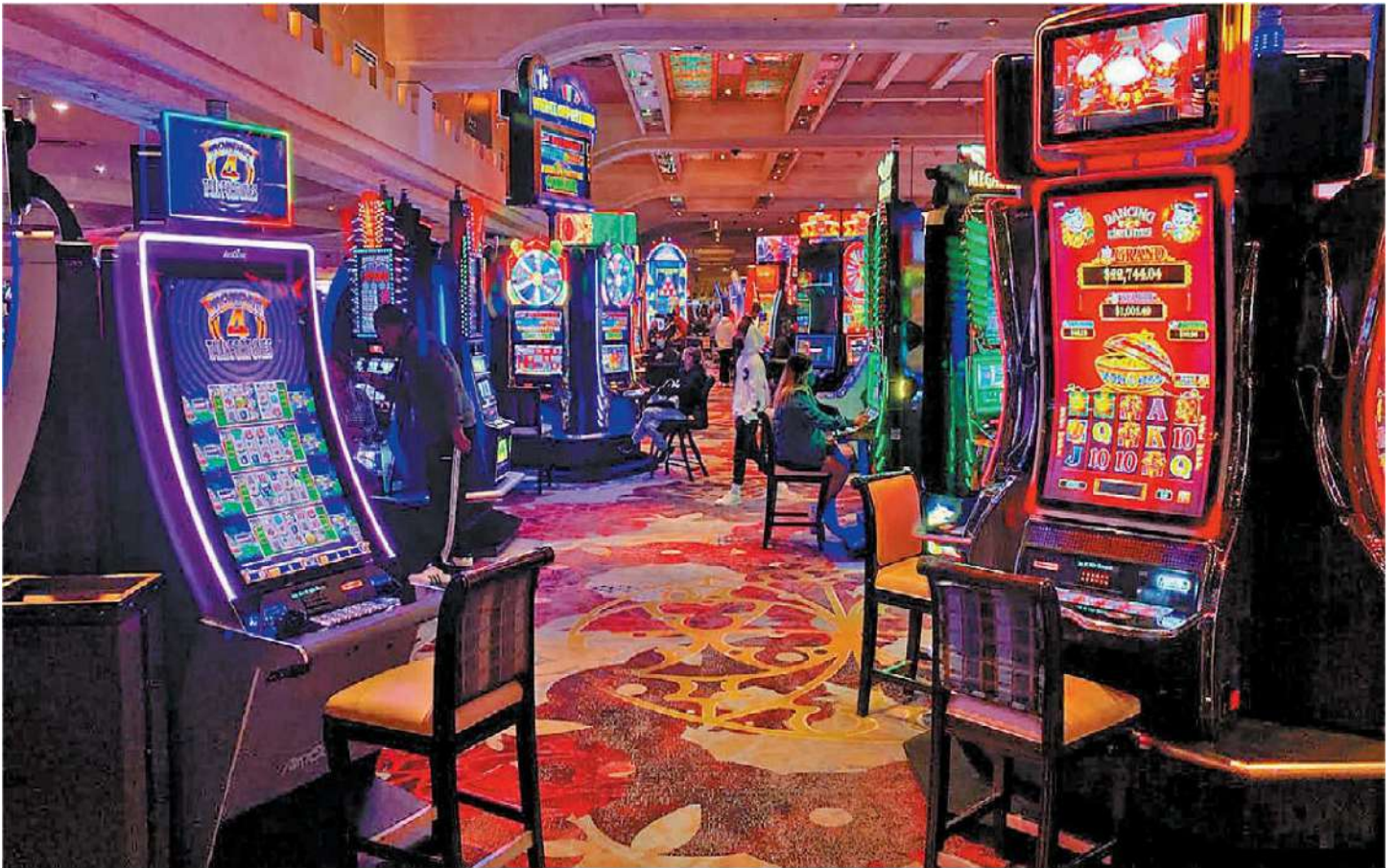
La máquina era muy diferente a las demás, tan iguales, salvo excepciones como las que tenían alusiones a Game of Thrones . ESPECIAL