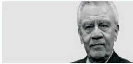
Lic. Mario Delgado Presidente de Morena:

C IUDAD DE MÉXICO.- Una de las grandes preocupaciones de Andrés Manuel López Obrador es su paso a la historia y sin duda lo hará, pero no por sus logros sino como un caso de estudio para la comunicación y el marketing político. ¿De qué otra manera se puede explicar que cuente con 61 por ciento de aprobación personal, cuando en las mismas encuestas la gente señala los fallos de su administración?