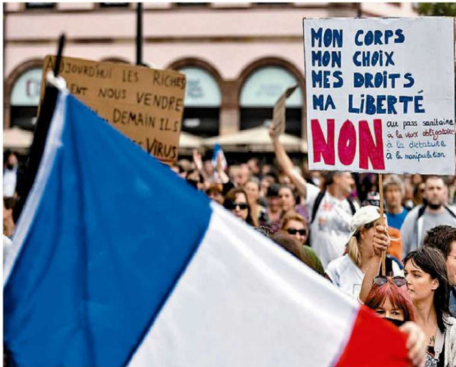
No son pocos los que todavía condenan las vacunas contra el covid-19. AFP