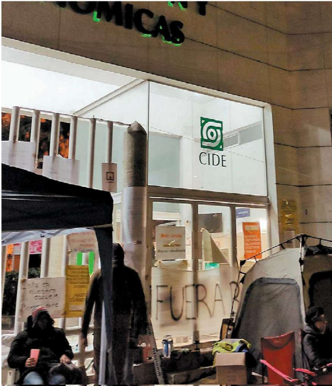
Alumnos tomaron las instalaciones del centro y llamaron a una marcha este sábado. ESPECIAL