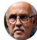
Miguel A. Navarro

Primera prueba electoral tendrá este domingo el gobernador de Nayarit, Miguel Ángel Navarro . Y es que hay votaciones para elegir a un senador, pues el actual mandatario dejó vacante el escaño y no tiene suplente. Morena busca que su candidata Rosa Elena Jiménez resulte triunfadora. De lo contrario, se quedará con un legislador menos en el Senado de la República.