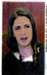
Ana Gabriela Guevara

:::: Los admirables atletas de la delegación mexicana ya ganaron tres medallas en los Juegos Olímpicos París 2024 (dos de plata y una de bronce), pero aún no llega la ansiada de oro. Eso sí, donde no hay duda de que se ganará es en la categoría de grilla y discusión directiva, porque tal parece que Ana Gabriela Guevara (directora de la Comisión Nacional de Cultura Física y Deporte (Conade) y María José Alcalá , presidenta del Comité Olímpico Mexicano (COM), sólo viajaron hasta