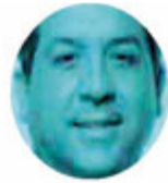
FRANCISCO GARCÍA CABEZA DE VACA

» Esta semana es la última en la que los aspirantes a la dirigencia del PRI, Alejandro Moreno y Lorena Piñón , podrán hacer campaña, pues el 11 de agosto es la elección. Cada uno de ellos tuvo hasta 6.6 millones de pesos para actividades proselitistas, aunque sólo se vio a Alito , quien pretende reelegirse, en actos de ese tipo.