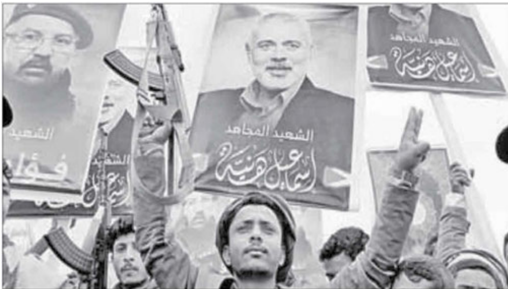
▲ Protesta en Yemen por el asesinato del líder de Hamas, Ismail Haniyeh.