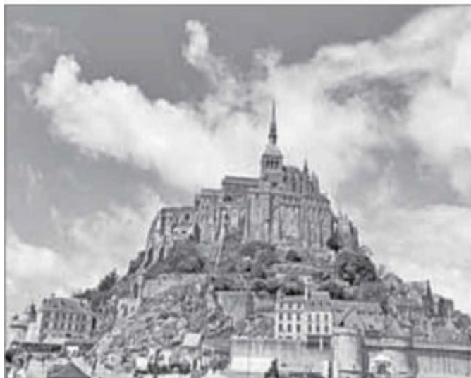
▲ La abadía de Mont Saint Michel en una tarde de verano.