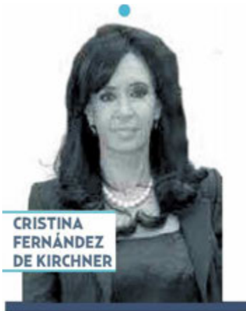
CRISTINA FERNÁNDEZ DE KIRCHNER