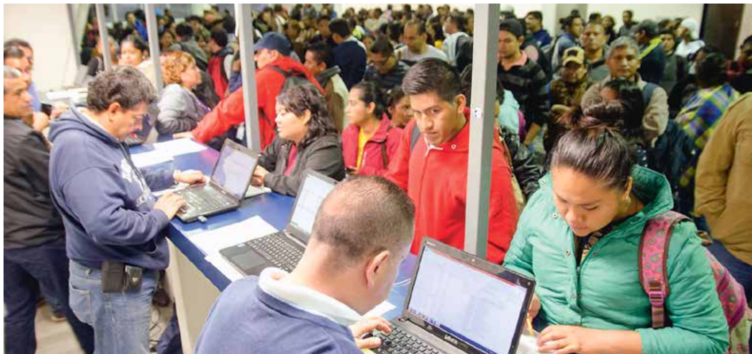
DECENAS DE PROFESORES al momento de su registro para sustentar el examen, en Puebla, ayer.

Avanza aplicación de exámenes en el país; en Oaxaca, pese a CNTE, acuden 1,124 y ya van 2,591; en Chiapas ya sólo faltan 300. pág. 8