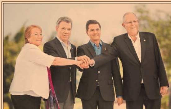
Los presidentes de México, Colombia, Chile y Perú constituyeron un fondo para financiar proyectos de infraestructura. P50

Gasto realizado en bienes y servicios culturales (PORCENTAJES)