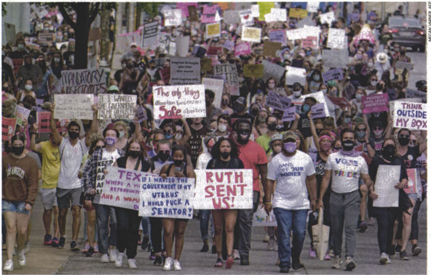
Miles de mujeres asistieron ayer a la manifestación en apoyo de los derechos reproductivos, en Atlanta, Georgia.

660 CONCENTRACIONES en todo EU se realizaron en apoyo de la libertad reproductiva.