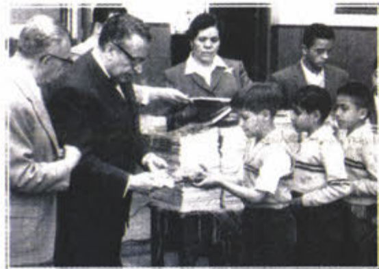
Entrega de libros de texto gratuitos a estudiantes.

Sin desestimar logros como la notoria reducción del analfabetismo, expertos opinan que la educación aún no es el gran igualador social al que aspiraba José Vasconcelos en 1921. / 10-13