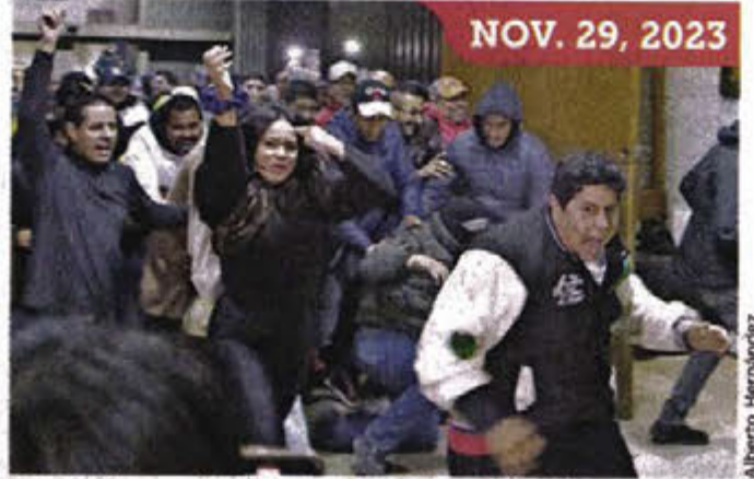
Una turba con decenas de simpatizantes de MC dio hace 3 meses “portazo” en el Congreso de NL e irrumpió en el Pleno.

que los acusados deberán permanecer en arraigo domiciliario, después de una audiencia de imputación que inició la mañana del viernes y se prolongó durante 28 horas. Fuentes allegadas al caso informaron que la Fiscalía estatal les imputó los delitos de daño en propiedad ajena doloso y equiparable a la resistencia de particulares. Entre los procesados hay candidatos de MC a puestos federales y personas que se registraron para competir por cargos locales.