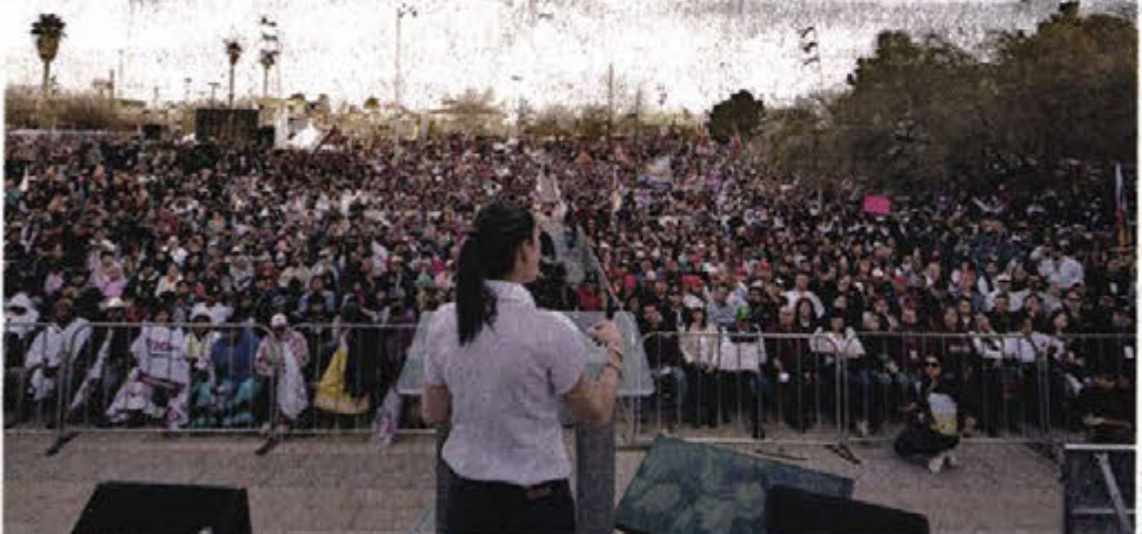
Sheinbaum tuvo, en Ciudad Juárez, su segundo mitin de la campaña electoral.