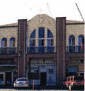
El hotel estaba situado a 300 metros de la línea fronteriza.

Con la suspensión de los recursos federales para este tipo de albergues, en 2019, su fundador, Sergio Tamal Quintero, inició un peregrinar para costear la operación del hotel, que tenía capacidad de alimentar y acoger a 600 personas al día. La renta mensual empezó en diez mil pesos y terminó en 40 mil; el recibo de luz era de 45 mil pesos en temporada de calor.