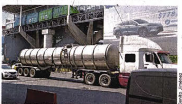
Las pipas de Adolfo Trejo Castorena abastecen de agua desde hace 15 años al AICM.