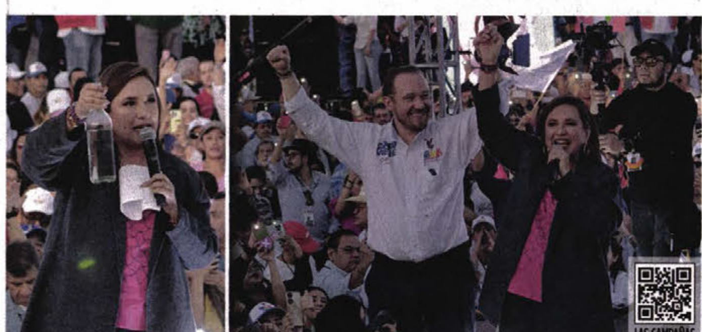
CAMPAÑA EN CDMX. Taboada acompañó a Gálvez en su mitin en el Parque Bicentenario. La candidata presidencial mostró una botella de agua distribuida por pipas de la CDMX y retó a Sheinbaum a echarse un trago de ese líquido.