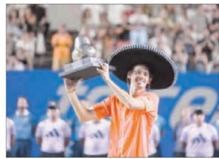
▲ El australiano se impuso al noruego Casper Ruud.