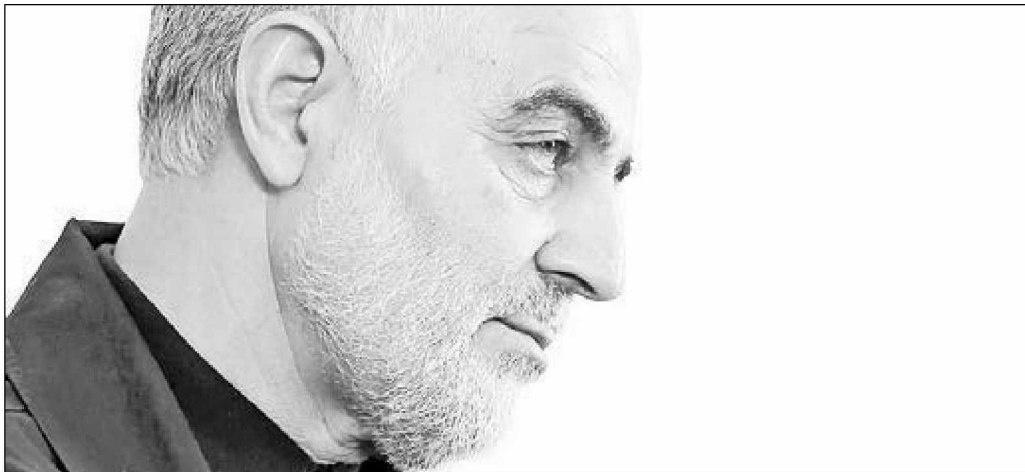
▲ Se cumple un año de la ejecución del general Qassem Soleimani.

¿QUÉ ES LO que no hará G4S/Allied Universal en México ( https://bit.ly/3n4qC1v )?