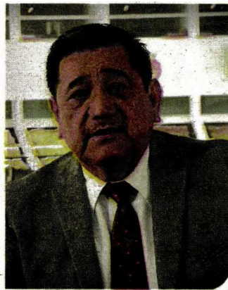
FÉLIX SALGADO MACEDONIO

A través del libro, Escritoras contemporáneas , la crítica e investigadora estadounidense completa un ciclo de ensayos y entrevistas en torno a la literatura femenina mexicana contemporánea con lo que ha inspirado a diversas iniciativas a que se visibilicen a las mujeres en la literatura nacional.