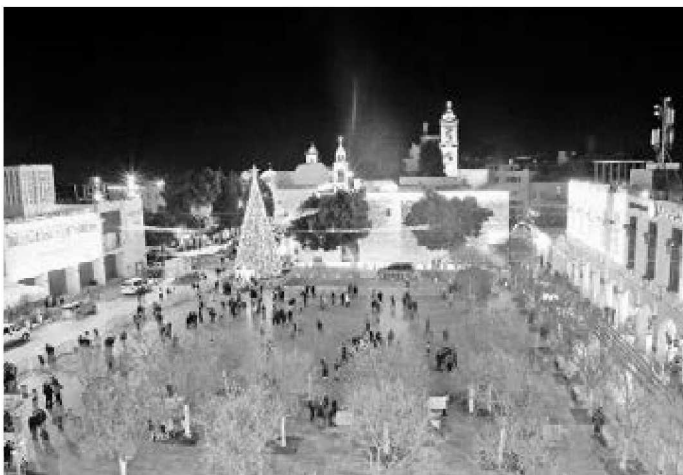
▲ En la legendaria ciudad, las celebraciones también fueron opacadas por el coronavirus, por lo que hubo poca gente en la plaza de la iglesia de la Natividad.