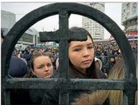
En Moscú, rusos esperan afuera de la iglesia donde fue velado el líder opositor Alexei Navalny.