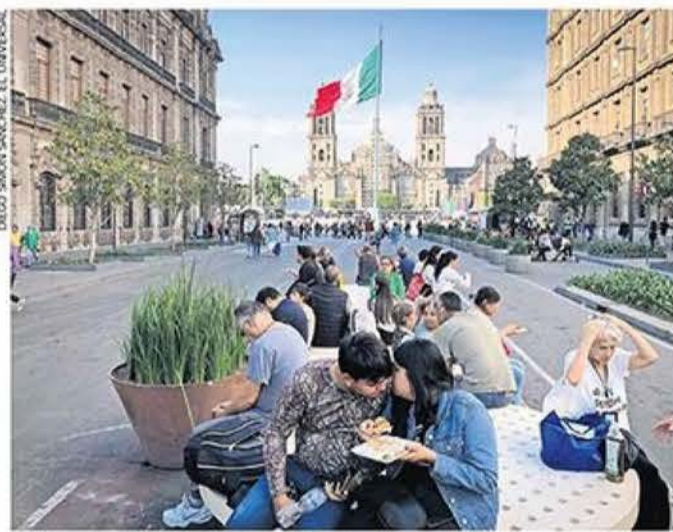
Los semáforos en la zona de la Plaza de la Constitución fueron retirados; la delimitación de los carriles de uso compartido será con macetas.