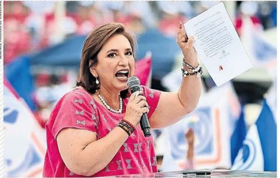
Ante más de 20 mil personas en Guanajuato, la candidata opositora garantizó que, en caso de ganar la elección, no eliminará ninguna asistencia social del presidente Andrés Manuel López Obrador. | A5 |

"PACIFICAREMOS EL PAÍS EN SEIS AÑOS", PROMETE ÁLVAREZ MÁYNEZ DESDE BASTIÓN DE MC | NACIÓN | A4