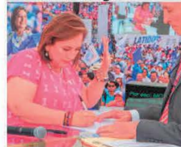
Xóchitl Gálvez se compromete a mantener los programas sociales.