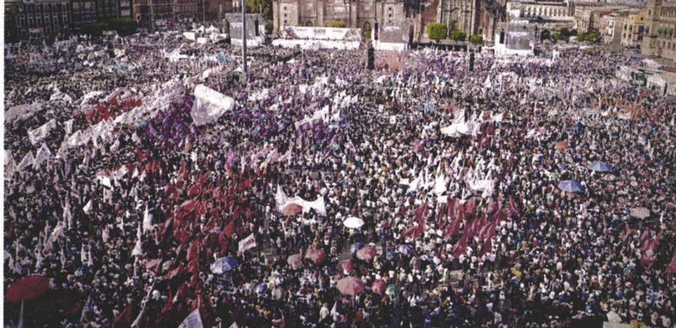
■ Claudia Sheinbaum arrancó su campaña ante 350 mil personas en el Zócalo, según datos del Gobierno de la CDMX.