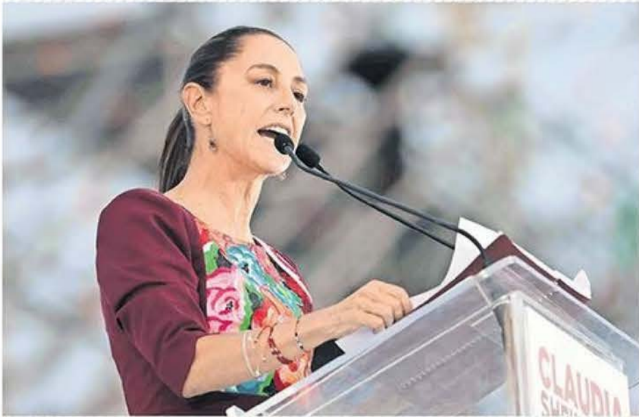
La aspirante presidencial de la coalición Sigamos Haciendo Historia inició su campaña cobijada por un Zócalo abarrotado y prometió terminar con la reelección de cargos públicos para 2030. | A4 |

GÁLVEZ PACTA CON SANGRE: MANTENDRÁ PROGRAMAS