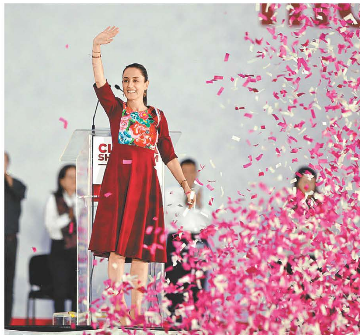
El gobierno capitalino calculó una asistencia de 350 mil personas en el Zócalo. JORGE CARBALLO