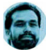
JORGE ÁLVAREZ MÁYNEZ

› Propuesta polémica lanzó la candidata de la alianza opositora, Xóchitl Gálvez : construir una prisión de alta seguridad. De inmediato le llovieron críticas, pero aclaró que sería sólo para delincuentes altamente peligrosos y sentenciados, y para nada busca imitar al presidente Nayib Bukele , de El Salvador.