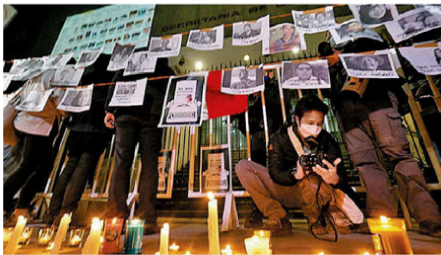
Periodistas protestan frente a Segob. JAVIER RÍOS

Día con día se acumulan las evidencias de un peligro creciente al periodismo, incluido el embate del Presidente desde su pulpito. Es importante, por lo que representa la libertad de expresión, no ceder en su ejercicio y también no caer en la provocación para reproducir la intolerancia que viene de enfrente. Estimo que no hay manera de cambiar a la autoridad actual por sus ideas fijas y porque sabe bien que llegó la hora en la que es inevitable el balance de su gobierno, como inevitable también es la investigación periodística que aborda asuntos altamente sensibles a los hombres del poder. Así ha sido siempre y no hay razón alguna para que esto vaya a ser hoy diferente. Además, como bien se dice, ellos se van, los medios se quedan. ■