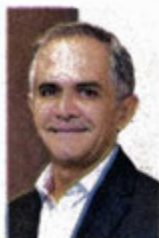
Miguel Ángel Mancera

::::: Era 2012 cuando Miguel Ángel Mancera había arrasado en la elección a la Jefatura de Gobierno. Llegaba entonces al Antiguo Palacio de Gobierno arropado por las multitudes y una votación histórica con más de 60%