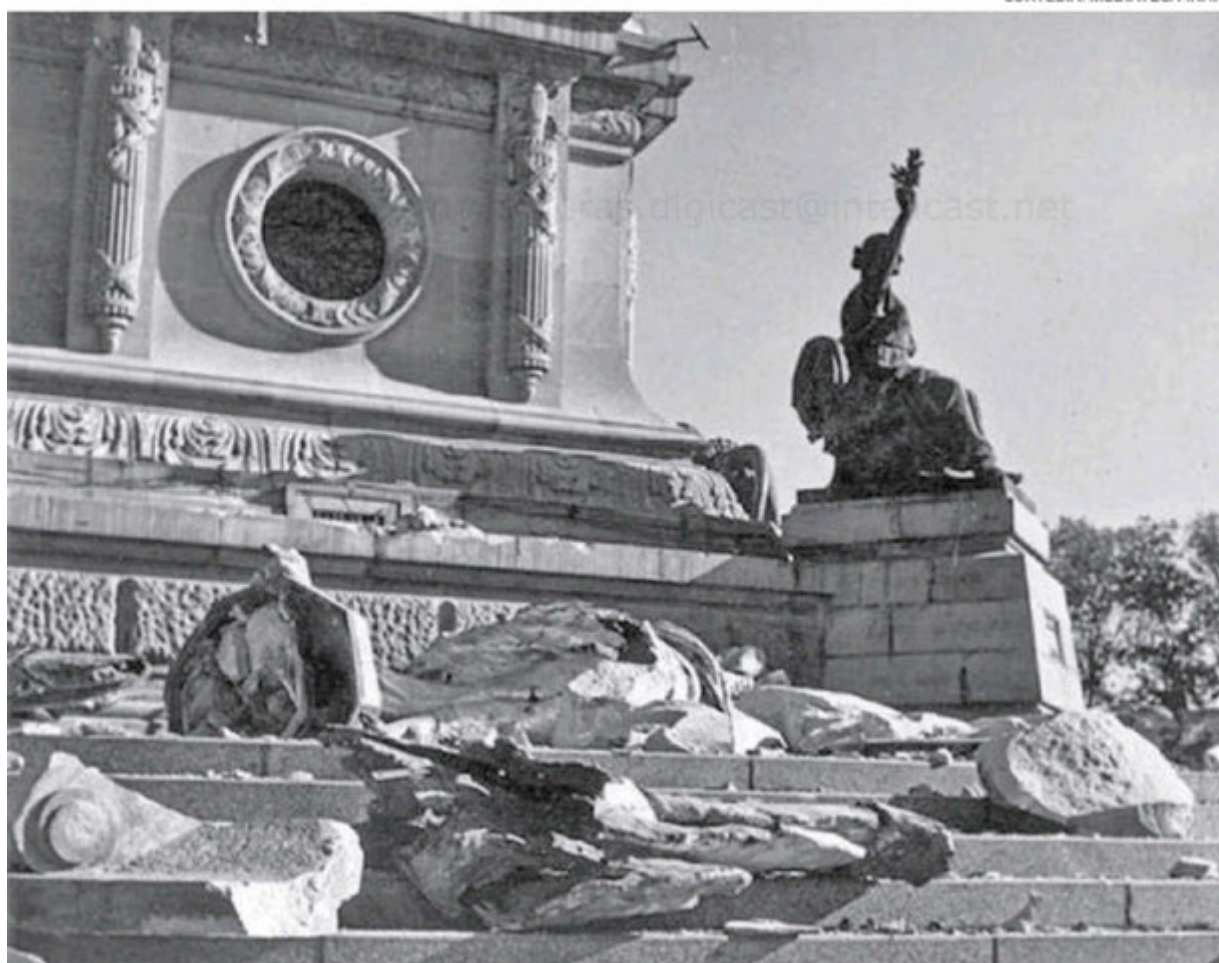
El terremoto de 1957 provocó la caída del Ángel de la Independencia