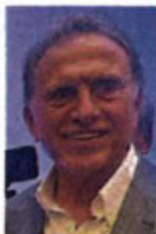
Miguel Ángel Yunes Linares

:::: Desde Veracruz, nos platican que “como pata-da al hígado” cayó a los morenistas la reaparición del exgobernador Miguel Ángel Yunes Linares (PAN), quien está considerado como candidato al