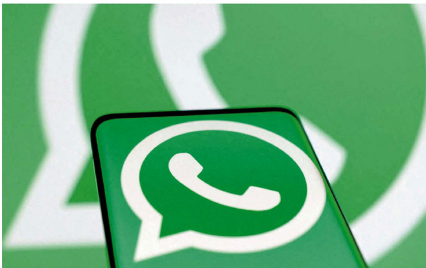
La aplicación de mensajería instantánea.