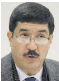
Javier Corral Jurado

Desangelado, nos platican, lució el Segundo Informe del gobernador de Chihuahua, Javier Corral Jurado (PAN), al grado que varios ciudadanos de a pie ni siquiera tenían conocimiento de que sería este viernes y, al verlo caminar del Palacio de Gobierno al Congreso local, simplemente se sorprendieron o lo ignoraron. Sin embargo, nos señalan, el tema terminó por cobrar interés por dos razones: el evidente uso de un chaleco antibalas que portó el mandatario estatal mientras caminaba por las calles, y un grupo de manifestantes apostados al exterior del Legislativo, quienes una noche antes fueron obligados por la fiscalía a levantar un plantón que tenían en la zona. Sobre el chaleco, nos señalan que aunque don Javier intentó esconderlo bajo el suéter, la estrategia no le funcionó y tanto ciudadanos como periodistas notaron la protección. Por cierto, nos dicen que los opositores del góber aseguraron que Corral no dijo nada nuevo, pues como siempre, buscó culpables para justificar los problemas en la entidad.