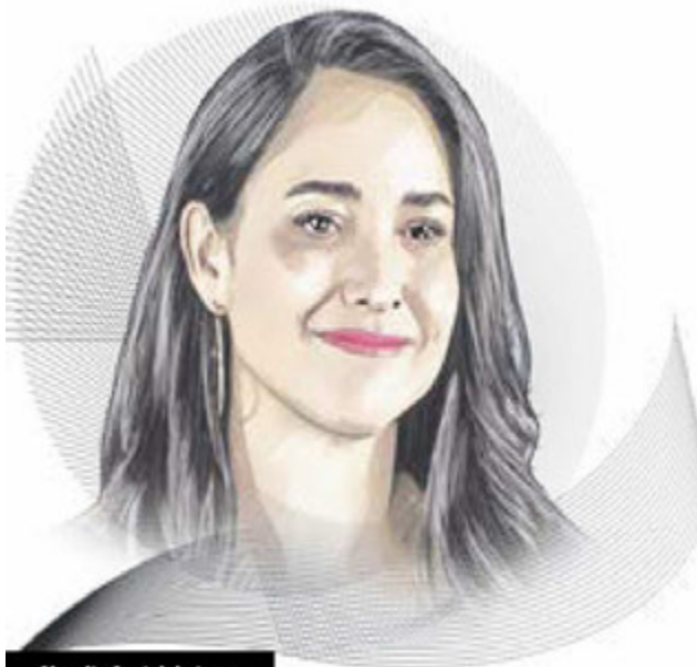
Claudia Curiel de Icaza

Josefina Rodríguez Zamora , secretaria de Turismo de Tlaxcala y próxima secretaria federal, sin duda le dará un renovado y necesario aire joven a la dependencia, que en estos seis años, a cargo de Miguel Torruco , sólo mantuvo la inercia de lo que se venía realizando, pese a que siempre fue un crítico de lo que se debía hacer en esa área, pero que ya en el cargo se hizo poco.