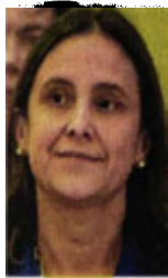
Luz Elena González

:::: Con la integración de Pemex y CFE a la Secretaría de Energía, como evalúan para el próximo sexenio, nos explican que ambas compañías tendrán manga ancha para apostar por proyectos cero rentables, como la refinación. De cumplirse la propuesta, nos dicen que la dependencia, que estará a cargo de Luz Elena González , contará con más de 200 mil trabajadores y las empresas productivas del Estado parecerían conglomerados sociales. Concretando la desaparición de la Comisión Reguladora de Energía y la Comisión Nacional de Hidrocarburos, nos comentan que se allanaría el camino para que se privilegie la toma de decisiones políticas sobre las técnicas. Todo a costillas del erario.