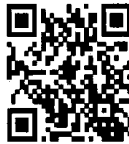
Los datos de la economía mexicana del Inegi.

Me queda claro que todos sabíamos que tendríamos un impacto negativo importante por factores externos al manejo económico local.